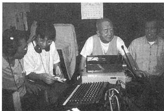
ミキサースタッフとレギュラーメンバー