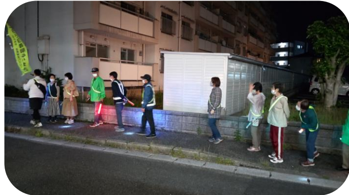
【R5.5.11 北九州市小倉南区広徳校区での防犯パトロールの様子】