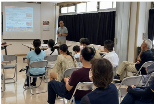
古老に聞くのスナップショット

また、「不動ストーリーブックづくり」のイベントとして7/23(日)には地域に長く住む方から下目黒周辺の昔の様子を伺いました。会場いっぱいの賑わいから地元への想いを感じました。座談会で聞いた情報を元に、文献調査や行政、個人、企業等への取材を通じて、10/1(日)の不動まち歩きルートを決めました。