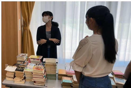
古本寄付のスナップショット①

その初イベントとして、8/5(土)に開催した古本寄付では、1,000冊以上の本を寄付頂きました。ボランティアとして当日の運営に協力してくれた中高生は予想以上の反響に驚きながらも本をきっかけにした地域の方との良い交流が出来ました。多くの方の熱意を受けて、ライブラリー開設のタイミングを2か月前倒して、12月にプレオープンすべく準備を進めています。