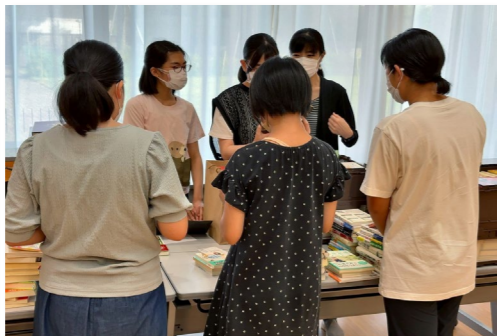
古本寄付のスナップショット②