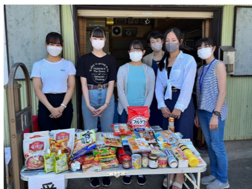
寄付された食品等の様子

また、目黒区としての取り組みにも協力し、10月の食品ロス削減月間に合わせて目黒区総合庁舎1階西口エリアにて行われる、食品ロス削減やフードドライブについてのパネル展(9/29~10/9)では、不動プロボノネットワークが行っているフードドライブの活動が紹介されています。