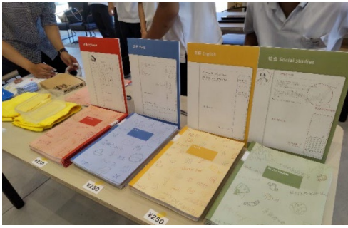
(印刷会社と共同開発した教科別ノート)