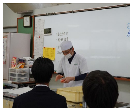
(和菓子職人による和菓子作り講習)

探究活動のテーマは「関市のまちなかを盛り上げるためには」。その課題解決案として「関有知マルシェ」（注：生徒の提案により、まちなか文化祭より改称）を企画しました。