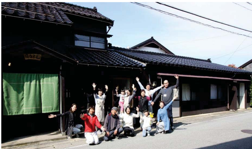
(古民家再生宿「カラふる カネモ」と助成事業で改修予定の空き家よしえむの前で)

佐渡南東部に位置する松ヶ崎・岩首地区の子育て世代・世帯が楽しく暮らすことをサポートするとともに、地域に住む子育て世代・世帯を増やし、暮らし続けられる地域をつくることを目的として活動をしています。