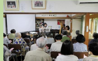
アイリッシュハープとフルートの演奏会