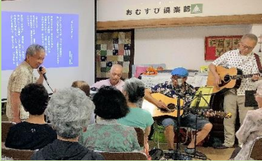
アメリカン・オールドソング演奏会