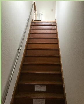
階段の手すりを追加（片側を両側とも）