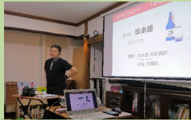
日本酒のお話し会