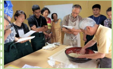
そば打ち体験にICUの留学生が参加