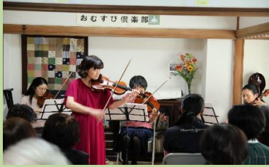
弦楽四重奏の演奏会