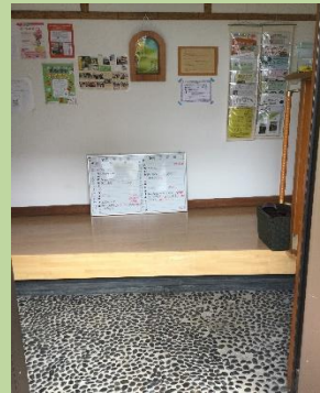
玄関の上がり框に踏み台を追加