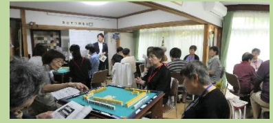
レディース脳トレ麻雀教室