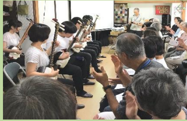
明治大学津軽三味線「響」の演奏会