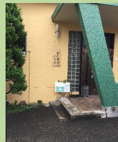
ポーチの段差部分に手すりを追加