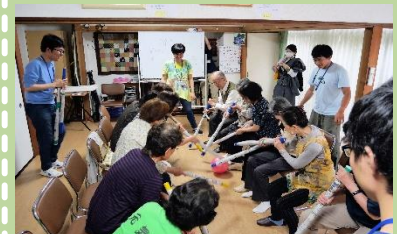
手作り&カフェに杏林大学医学部学生が地域体験で参加