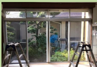
既存のサッシに高性能断熱ガラスのサッシを追加