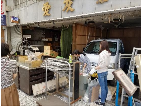
空き店舗内の清掃とバザー