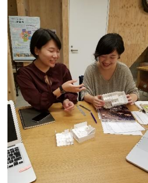
学生による基本設計