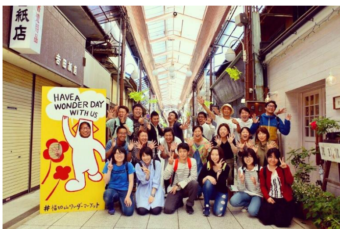
多様性あふれる実行委員会