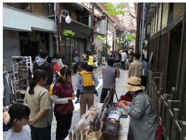
月1回のワンダーマーケットの様子