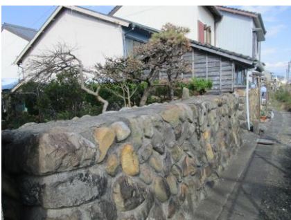
かつて海に面していた防波石垣、堰板を嵌める溝↑も残されている