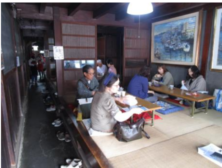
間口2間・奥行17間の町家建築 半間の通り土間 奥の間から玄関方向を見る