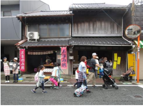
旧東海道沿いにあるF家住宅