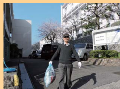
■写真上段 左から 路地裏・空き家を活用した多世代交流/高層分譲マンションにおける孤立化防止サポート/アートを軸とした空き家の一時利用と移住促進 ■写真中段 左から 空き住戸を活用した総菜カフェの開設・運営/ホームレスの方等への継続的な支援活動/成熟した戸建住宅地における地域資源の発掘 ■写真下段 左から 遊歩道管理を通じた良好な住まい環境づくり/住民による段階的な空き家対策活動/分譲マンションにおけるゴミ出しサポート活動

日時：令和元(2019)年7月12日(金) 12:30~17:30 (12:00開場) 場所：ひと・まち交流館 京都/2F大会議室(京都市下京区西木屋町通上ノ口上る梅湊町83番地の1) ※詳しくは裏面を参照 内容：プログラム(裏面)のとおり 定員：150名(事前申込制、定員に達し次第締切) 参加費：無料 主催：一般財団法人ハウジングアンドコミュニティ財団